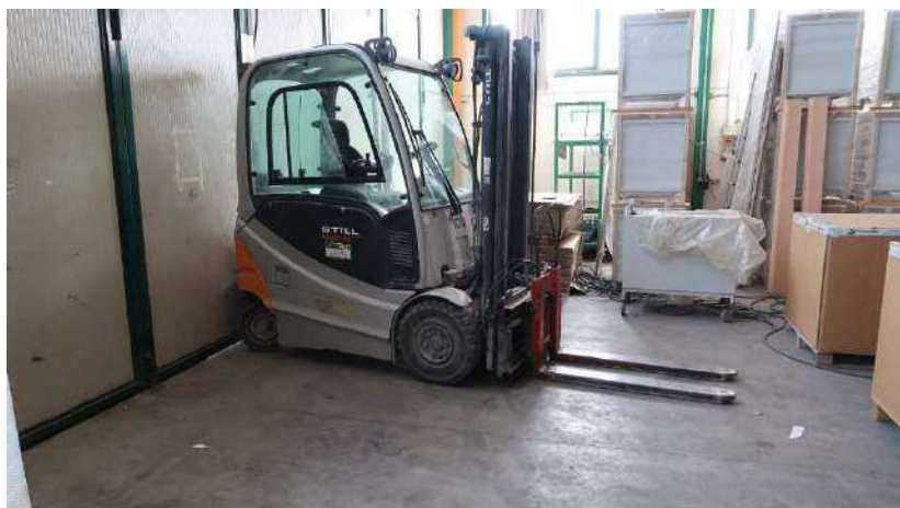
28 Carrello STILL ECU16