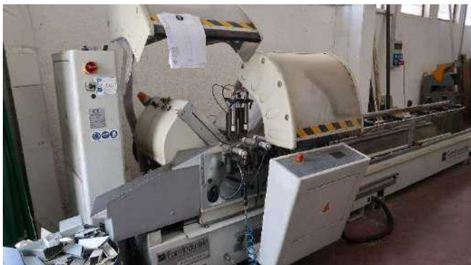
16 Foratrice per alluminio EMMEGI