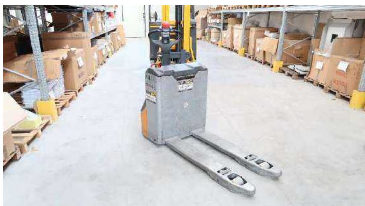
29 Carrello STILL EXV12